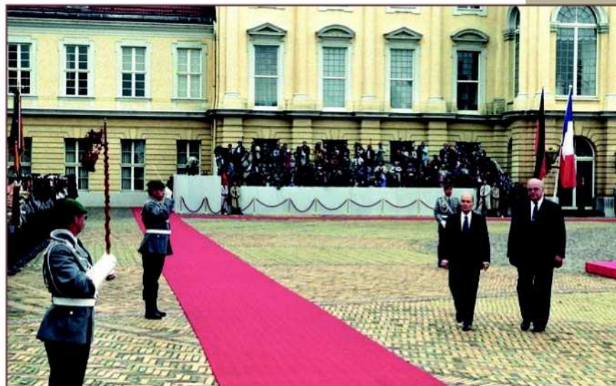
Helmut Kohl et François Mitterrand lors de la cérémonie de départ des troupes alliées de Berlin, château de Charlottenburg, 8 septembre 1994.

Le 14 septembre 1994, les militaires français se retrouvent au quartier Napoléon pour une émouvante cérémonie nocturne de dissolution des services. Ainsi disparaît le 11 e régiment de chasseurs, de même que le 46 e régiment d'infanterie, « fermé pour cause de victoire ». L'étendard de l'un et le drapeau de l'autre sont conservés au Service historique de la défense, à la salle des emblèmes du château de Vincennes. Le 28 septembre 1994, une ultime cérémonie militaire se déroule au quartier Napoléon à l'occasion de la remise symbolique des clés. Le colonel Rousselet, dernier chef d'état-major des FFSB et ancien chef de corps de 1990 à 1992, préside la prise d'armes. Le colonel Hoppe, son homologue, devient le