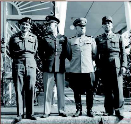
Réunion à Berlin des représentants des pays alliés, 5 juin 1945.

Capitale en ruines d'un III e Reich qui devait durer mille ans, Berlin acquiert vite après 1945 un nouveau statut imposé par la guerre froide. Le partage de la ville entre les ex-Alliés en fait le baromètre de la confrontation Est-Ouest dont certains soubresauts ont des répercussions directes sur l'agglomération. Dans le secteur français, les militaires assistent à cette évolution qui conduit à redéfinir leur mission initiale d'occupation.