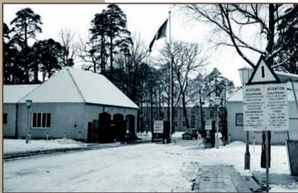
Le quartier Napoléon, février 1955.

Capitale en ruines d'un III e Reich qui devait durer mille ans, Berlin acquiert vite après 1945 un nouveau statut imposé par la guerre froide. Le partage de la ville entre les ex-Alliés en fait le baromètre de la confrontation Est-Ouest dont certains soubresauts ont des répercussions directes sur l'agglomération. Dans le secteur français, les militaires assistent à cette évolution qui conduit à redéfinir leur mission initiale d'occupation.