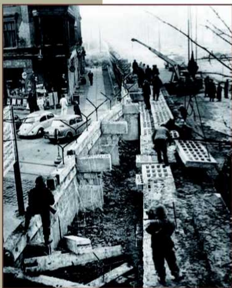
Construction du mur dans la Zimmerstrasse à Kreuzberg, novembre 1961.

bon nombre de militaires français qui ont eux-mêmes connu l'occupation, la clandestinité, les combats ou la captivité. Les premiers temps sont consacrés à la gestion des mouvements de population (prisonniers, réfugiés, déportés), à la recherche de dépôts d'armes clandestins, à la traque de criminels de