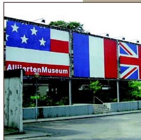
Le musée des Alliés.