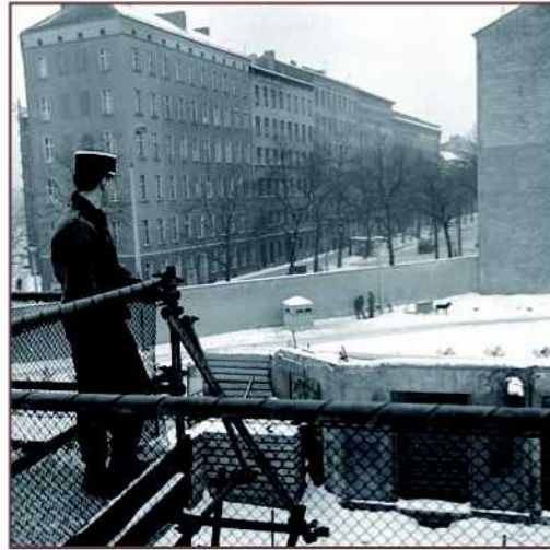
Gendarme observant le côté est du mur, mars 1970.