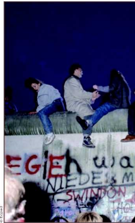
Berlinois sur le mur, la nuit du 9 novembre 1989.

► guerre et à la dénazification de la société allemande. Certaines activités initiées à l'époque vont se perpétuer dans le temps. Ainsi, la garde des hauts dignitaires nazis condamnés au procès de Nuremberg se poursuit jusqu'au décès de Rudolf Hess en 1987, à la prison de Spandau. La relève des troupes détachées par chaque secteur pour quatre mois donne lieu à un véritable cérémonial.