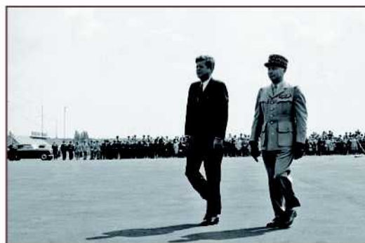
Visite du président américain J.F. Kennedy à Berlin, 26 juin 1963.